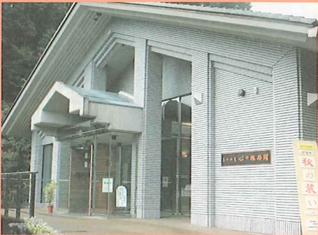
東山魁夷心の旅路館