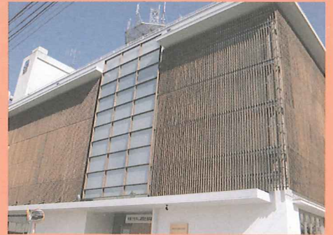
中山道歴史資料館