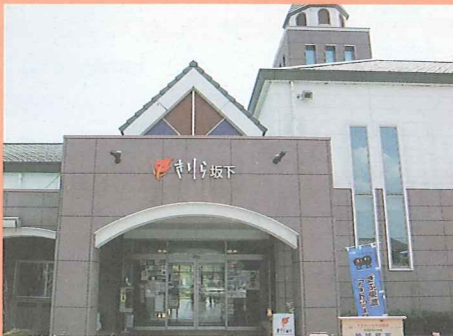
道の駅きりり坂下