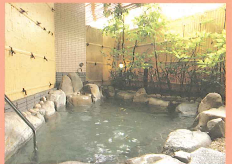
クアリゾート湯舟沢

【申込先】 中津川商工会議所企画広報室 E-mail info@cci.nakatsugawa.gifu.jp 〒508-0045 中津川市かやの木町1-20 電話0573-65-2154 FAX0573-65-2157